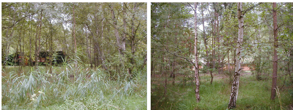
Eksempler på sommerhuse i området indpasset i naturen

Lokalplanområdet i øvrigt omfatter ikke naturområder, anlæg m.m., der er omfattet af Lov om naturbeskyttelse.